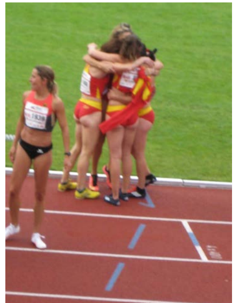
L'equip femeni relleus 4x400 celebra el 1r lloc aconseguit.