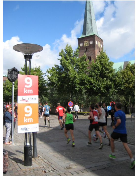
Centre ciutat. Mitja marató (pas km 9)