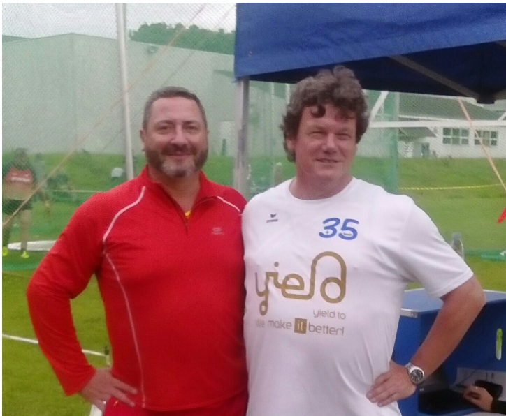
Fernando Alonso (esquerra)