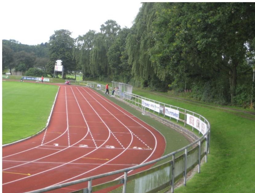
Estadi de Viby (panoràmica)

Respecte a l'edició celebrada a Aarhus l'any 2004, cal ressaltar en l'elecció del segon estadi per encabir totes les proves de l'esdeveniment. Llavors fou Randers, ciutat situada a uns 40 kms d'Aarhus, tot un inconvenient pel desplaçament dels atletes per la distància entre totes dues ciutats. Per aquesta ocasió, s'ha disposat de l'estadi de Viby, situat a només 2,7 kms de l'estadi principal.