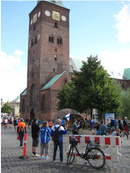
Centre ciutat (Domkirken). Mitja marató.