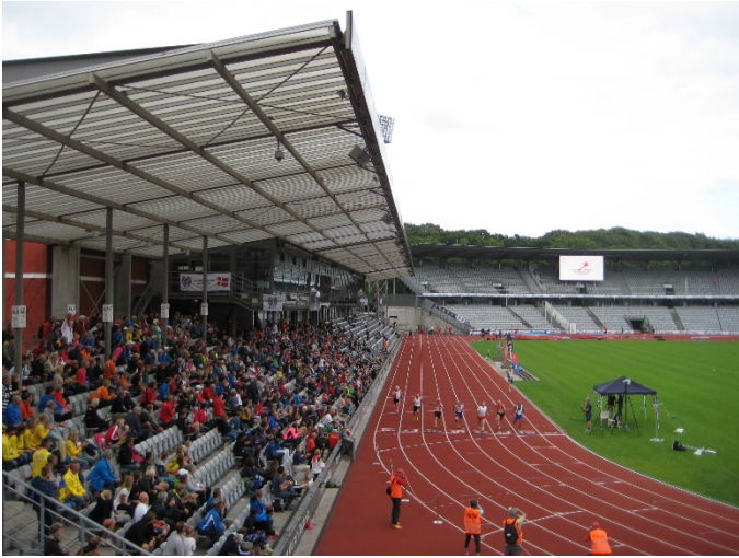
Arribada 100 M60